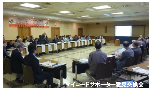
マイロードサポーター意見交換会

この事業は、地域の皆さんと県・市町が協力し、『私たちの道は、私たちの力できれいにする』取り組みです。事業に登録している村山地域14市町の30団体の代表者らを中心に約70名が出席。『高齢化社会における担い手育成』をテーマに意見が交わされ、『高校生が活動に加わるようになった』、『子どもたちと一緒に活動し、交流するのが楽しい』などと、担い手育成の事例や手掛かり等が話し合われました。