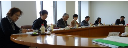
東南村山地域知恵袋委員会（3月15日 本庁舎）

3月11日に村山総合支庁北庁舎にて西村山・北村山地域の知恵袋委員会を、15日に本庁舎にて東南村山地域の知恵袋委員会を行いました。このたびの委員会では、7月の第1回知恵袋委員会いただいた県政に対する意見について、委員の意見が来年度の施策にどのように反映されたか、また、県はどのような事業でどういう支援をしていくかなどを報告した後、意見交換を行いました。委員一人ひとりから、県の対応に対する質問や、委員自身の地域でのこれからの活動への意気込みなどの発言があり、支庁長をはじめ、各部長や地域振興監、教育事務所長と活発な意見交換が行われました。1年間という短い間でしたが、貴重なご提言をいただき、どうもありがとうございました。委員の皆様からいただいたご意見を生かして、各種事業に取り組んでまいります。