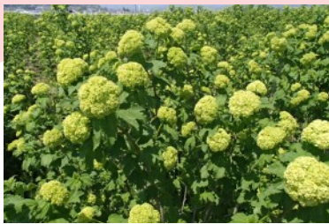
「スノーボール」 切花として人気があり、色合いや姿は ウェディングにピッタリ。 西村山地域が日本一の産地です!!