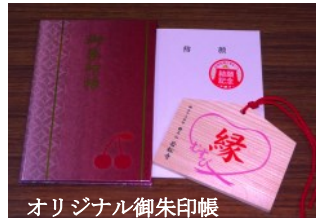
オリジナル御朱印帳