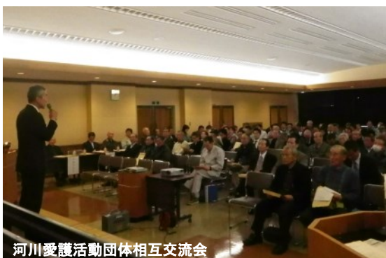
河川愛護活動団体相互交流会

河川愛護活動団体、支援企業のほか河川のボランティアに興味のある方を対象とした「ふるさとの川愛護活動支援事業 相互交流会」を2月25日に村山総合支庁西庁舎講堂にて開催しました。