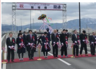
テープカット・くす玉開披