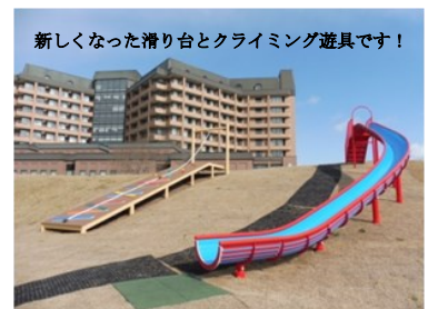
新しくなった滑り台とクライミング遊具です！

山形市青柳にある「健康の森公園」にて、昨年11月に遊具を更新しました。工事で張替えた芝生の養生のため、立入りをご遠慮いただいていたが、このたび養生期間を終えて開放します。今回、古くなったローラー滑り台や、クライミング遊具などを更新し、より楽しめる施設となりました。桜の季節も迎え、公園内も華やかになりますので、是非遊びに来てください。