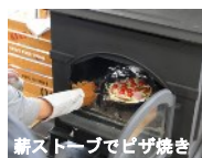
薪ストーブでピザ焼き