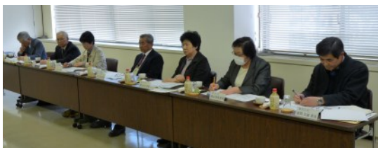
西村山・北村山地域知恵袋委員会（3月11日 北庁舎）