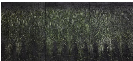
《命の生まれるところ》2024年 木炭、パネル

1998年、埼玉県生まれ。2024年、武蔵野美術大学大学院造形研究科修士課程修了。人間の社会活動と自然の営みの相互作用をテーマに、登山や里山の散策等、フィールドワークを重要視した制作スタイルによって、多様な木炭画を制作。近年は海外でのトレッキングを経験するなど、あらゆるフィールドへ足を運び作品の幅を広げようと試みています。主な展示に「TO CHOLATSE」(STAGE-1 2023年)、「雲ノ平山荘アーティスト・イン・レジデンス」(雲ノ平山荘 2023年)「白日展 創立百周年記念展」(国立新美術館 2024年)など。