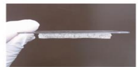
図 2 ゲルの外観