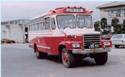
運行当時のボンネットバス