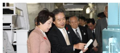
発電所内で説明を受ける吉村知事

そこで、神室ダムでも震災後から検討を重ねた結果、河川流水に必要な水量として放流している水を活用して水力発電を行うこととしました。この水力発電を行う「神室発電所」は、山形県企業局が建設し、最大出力420kW、約860世帯分の電力量を賄うもので、平成29年10月28日(土)に完成式典を開催し、売電を開始しました。