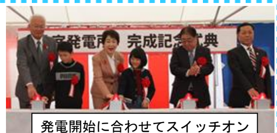
発電開始に合わせてスイッチオン

東日本大震災では大きな発電所が停止したため、私たちの生活に欠かせない電気が一時供給できなくなりました。これをきっかけとして、県では、太陽光や風力、水力など再生可能エネルギーの導入を進めています。