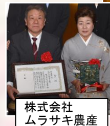
株式会社 ムラサキ農産