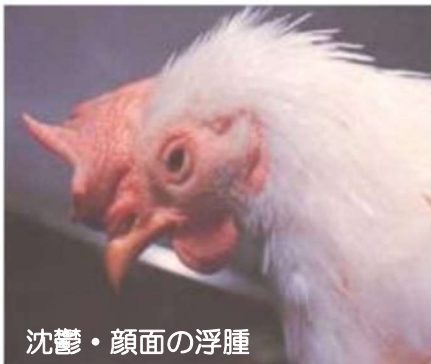
沈鬱・顔面の浮腫