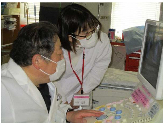
最上町立最上病院での見学