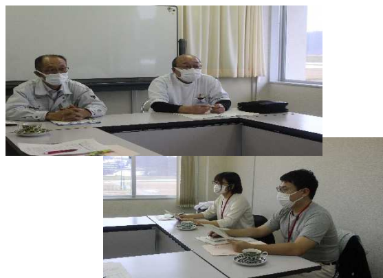
大蔵村診療所での説明