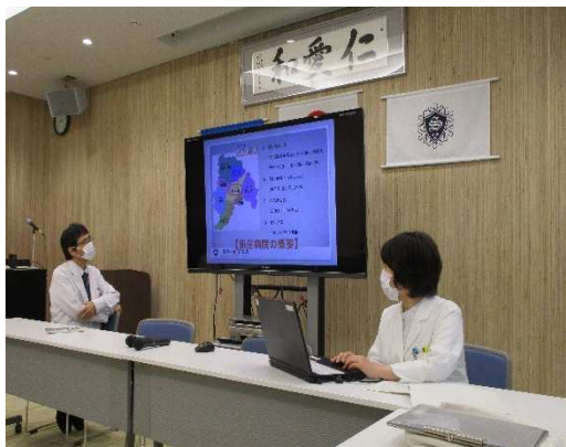
県立新庄病院での説明

参加した学生からは、「それぞれ特徴ある医療機関を見学したことで、違った角度から医療を学べた」「今回の経験から新たに学ぶべきことが分かった」「これまで他の病院見学も経験あるが、比べものにならないくらい学びが多く非常に有意義だった」等の感想が寄せられました。