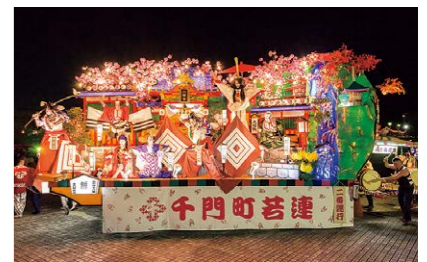
ユネスコ無形文化遺産登録 新庄まつり

食では、山菜やそば、最上伝承野菜が有名です。肘折・赤倉・瀬見などの温泉、義経や芭蕉ゆかりの地、最上川峡の絶景、金山町の美しい街並みなど豊かな観光資源にも恵まれています。