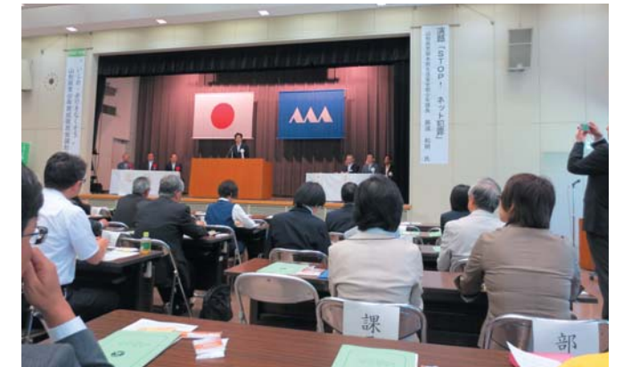
【山形県青少年育成県民会議総会】