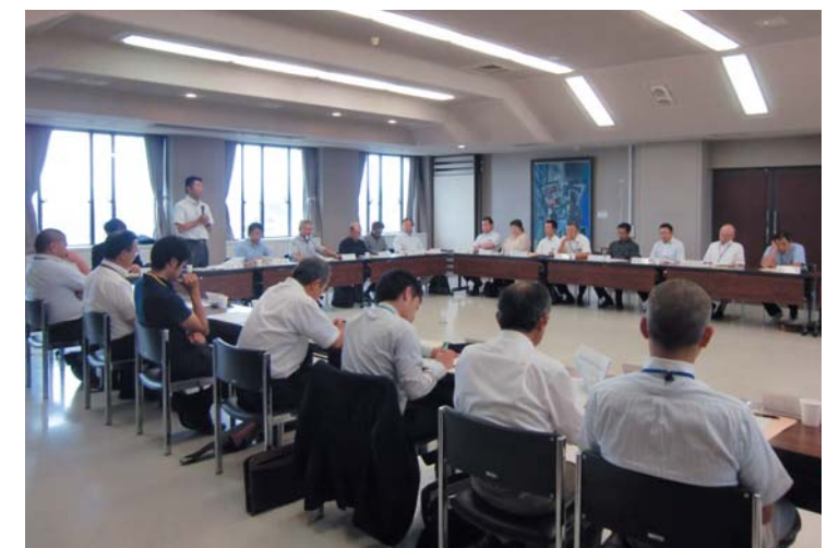
【第1回実行委員・事務局員拡大合同会議 6/21】