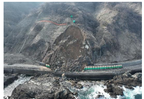
鶴岡市今泉地内 崩落箇所