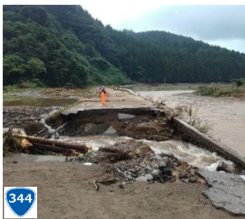
被災時 (酒田市上青沢地内)

引き続き、安全確保を最優先に復旧に向けた検討を進めるとともに、進捗状況や通行情報を速やかに周知してまいります。 建設総務課 事業調整担当 ☎ 0235-66-5723