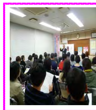
月光園衛生委員会主催職員研修