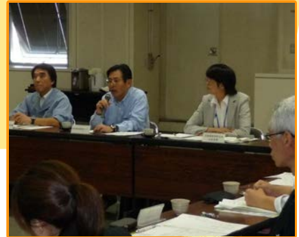
健康づくり 協議会の様子

協議会前に開催された禁煙研修会から参加された委員も多くたばこががんの関係は科学的根拠が明確であることから、職員の健康管理でも禁煙が重要だと確認できました。