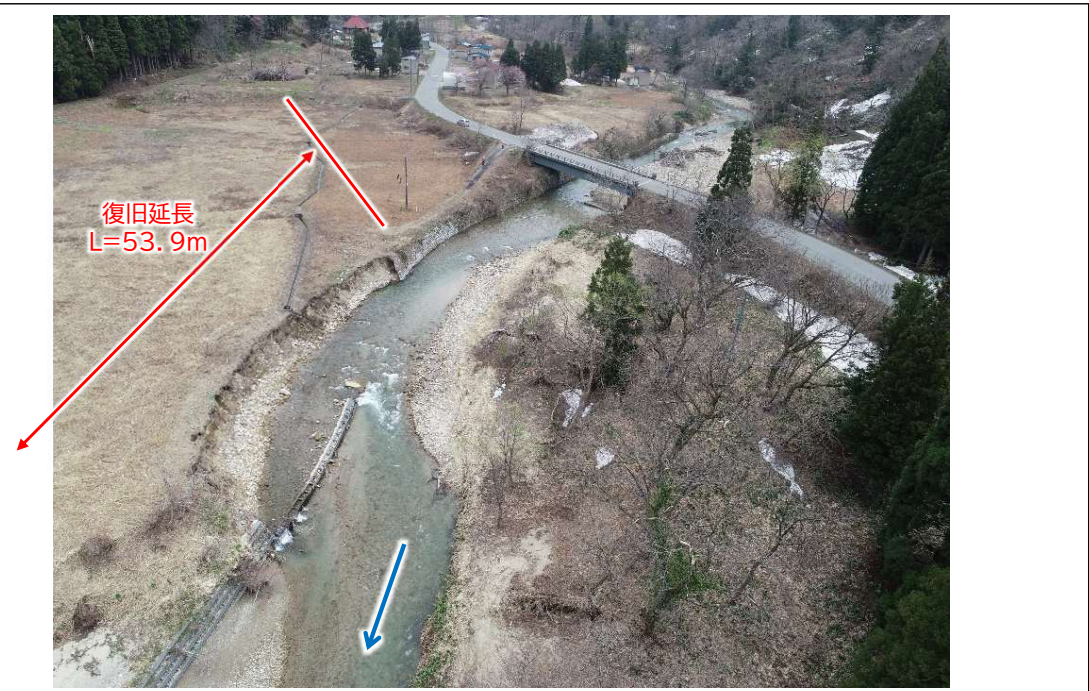
完成写真 撮影日：令和6年2月上旬