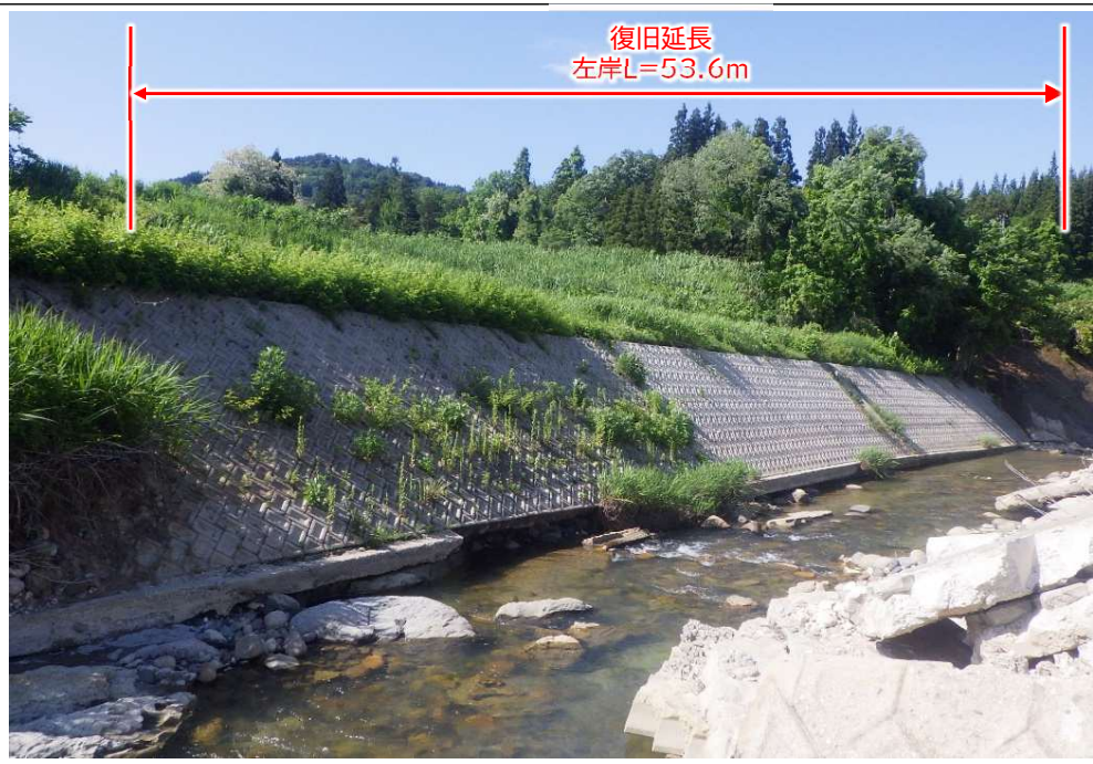
完成写真 撮影日：令和6年12月下旬