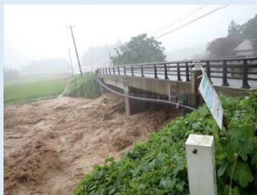
出水の状況 (令和4年8月3日)

「西置賜の現場」の記念すべき第1号では、災害復旧工事箇所の完成状況をお知らせするとともに、工事にご理解ご協力いただいた地域の皆さま、 また施工に携われた全ての建設関係会社の方々に感謝を申し上げます。