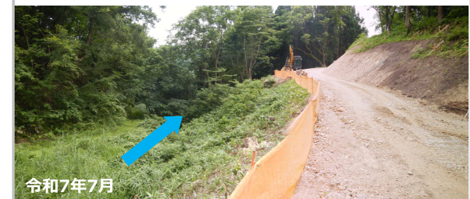
砂防堰堤位置 (工事用道路施工中)