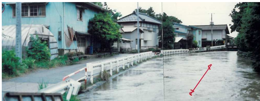
平成2年6月27日 集中豪雨