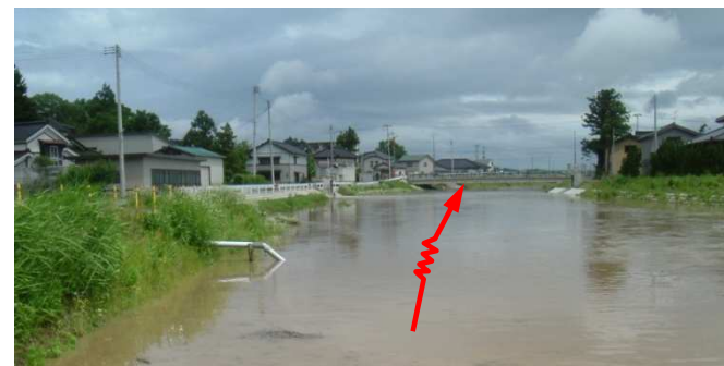
平成19年6月26日 集中豪雨