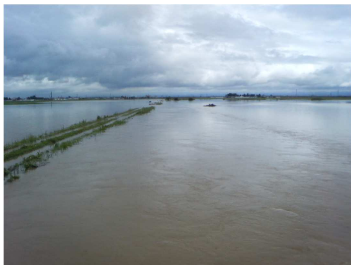
平成19年6月26日 集中豪雨