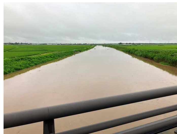
令和6年7月25日 集中豪雨においても越水被害なし