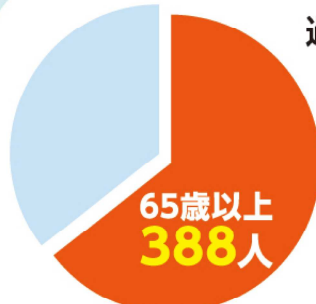
過去5年間の発生状況