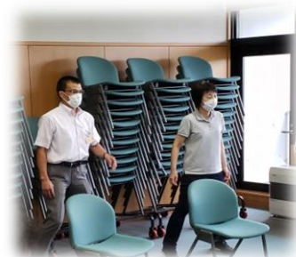
ゆめスポしらたかRO*KU 「元氣わくわく教室」体験

今後、地域住民により自主的・主体的に運営される総合型地域スポーツクラブが発展することを祈念いたします。