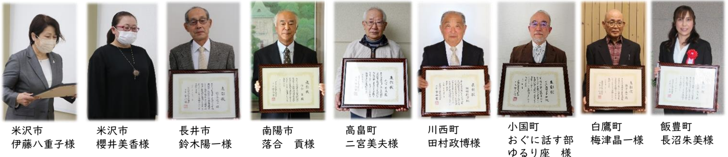
優良社会教育団体・職員等表彰者の皆様