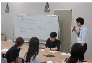
キックオフミーティング（7月）