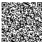
台湾インバウンド向け リーフレット