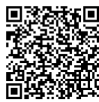
おきたま花むすび 2026

※いずれのリーフレットも、下記 URL に掲載されています。 URL : https://oki-tama.jp/pamphlets/