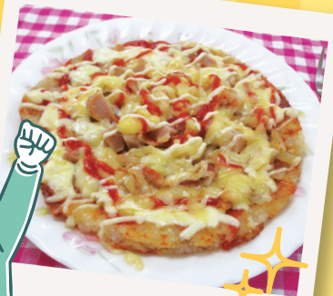
あまったごはんで作る! ライスピザ