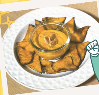
かぼちゃの皮チップスと ディップソース