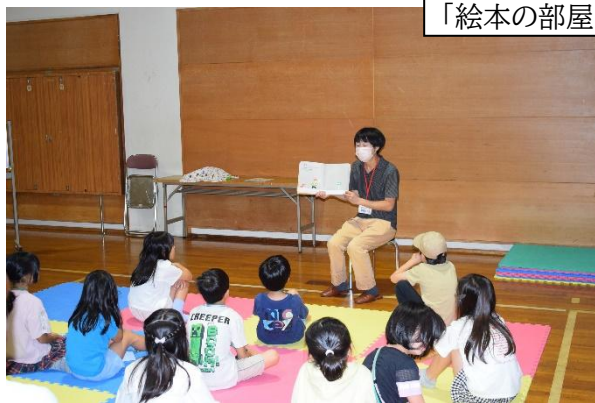
「絵本の部屋」の読み聞かせ