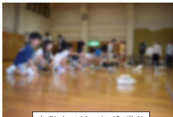
完成したエアカーリングで遊ぶ