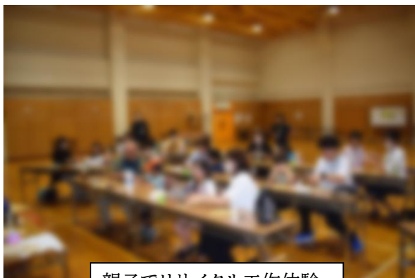
親子でリサイクル工作体験