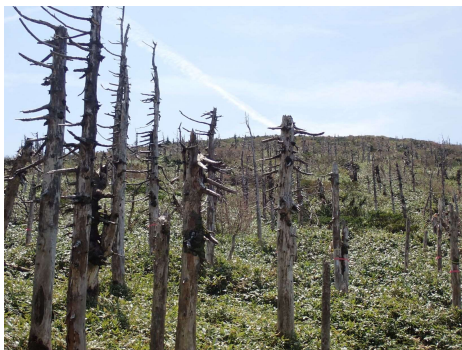
(オオシラビソ林枯損の様子)