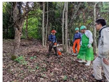
森づくり活動状況