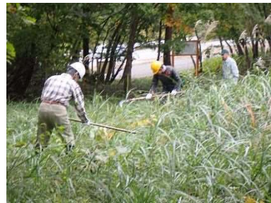
企業による森づくり活動の支援