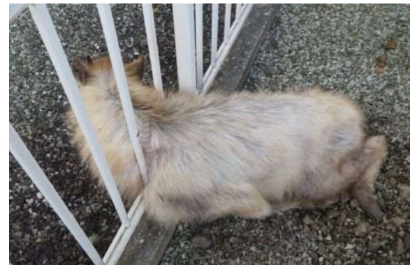
市街地に出没したカモシカ

・ 市街地に出没した大型野生鳥獣について、市町村や猟友会等の協力を得て不動化し、安全な奥山等へ移送し、放鳥獣等を実施する。