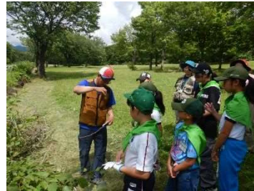
派遣した指導者による林内活動