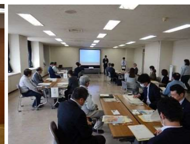
やまがた絆の森づくり交流会