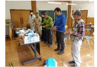
森づくり安全研修会