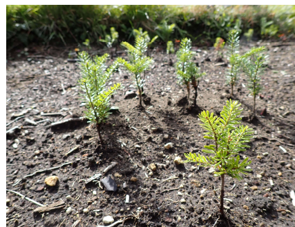
(圃場で播種とオオシラビソの稚樹)