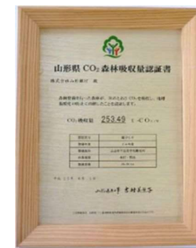
山形県CO 2 森林吸収量認証書