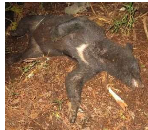
不動化した錯誤捕獲されたツキノワグマ