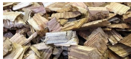
バイオマス燃料（木質チップ）