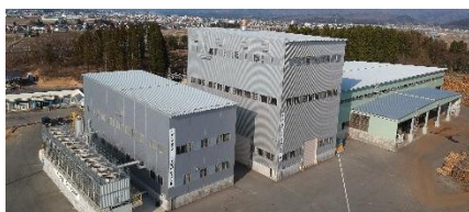
もがみ木質バイオマス発電所