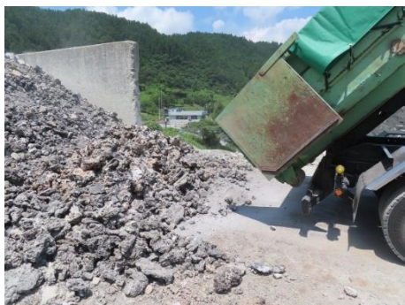
鋳滓を路盤材としてリサイクル