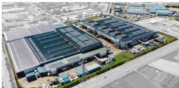
工場屋根に設置するメガソーラー発電設備

水使用量の低減については、自動市水供給システムの設定値を見直し、DX推進の一環として設置した流量計のデータを社内で常時監視することで、2025年度には2013年度比で市水使用原単位27%削減、市水使用量47%削減を実現しました。