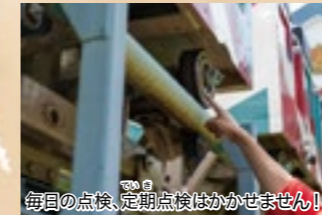
毎日の点検、定期点検はかかせません!

子どもから大人まで、それぞれの楽しみ方ができるのも、リナワールドの魅力です。また、春の桜、夏のキャブムシ、秋の紅葉など、季節ごとに変わる自然の景色も楽しめます。遊園地ならではのワクワク感と、自然の豊かさを感じられる場所として、ぜひご利用ください。