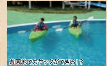
遊園地でカヤックができる!?

コスプレイベントをはじめ、本気で怖いホラーイベント、出会いを求めてのリナコンなど、時代に合わせた大人向けに楽しめる仕組になっています。