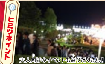
大人向けのイベントも盛りだくさん!

機械によるチェック、お客さまとスタッフが一緒にベルトなどの安全確認を行います。何度も確認を重ねて、安全安心に楽しめる仕組みになっています。