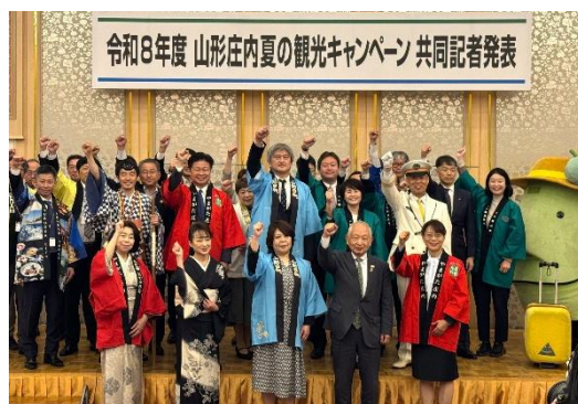
令和8年度 山形庄内夏の観光キャンペーン 共同記者発表