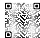
観光キャンペーン 特設サイト