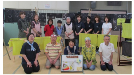
● 県内外からの参加者のみなさまと草木染作品

ワークショップ後の交流会では、昼食をとりながら、県内外からの参加者と地元田麦野地域の方々に田麦野の良いところや草木染の感想を語り合うなど親交を深めました。