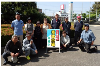
● 出店会員のみなさま