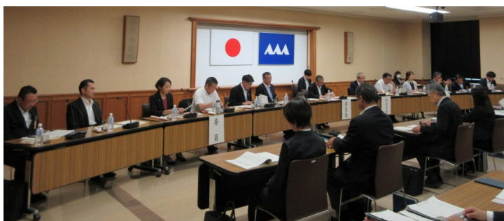
東南村山地域議員協議会