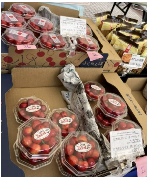
● マルシェにて販売された さくらんぼ