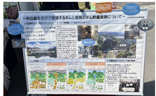
● ダム監査廊での保存の効果等について紹介

上市市で5月16日（土）、17日（日）に開かれた「山形ワインバル」において、県管理の前川ダムと県内ワイナリーが連携し、貯蔵実験を行ったワインが初めて提供されました。ダム内での酒類の貯蔵は、ダムのPRや、県産酒の消費拡大などを目的に令和6年9月に開始した取り組みです。