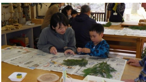
● 4/29 オープニングイベント（木エクラフト）