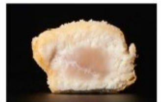
(参考画像) 左：火が通った鶏肉、右：中心部が生焼けの鶏肉