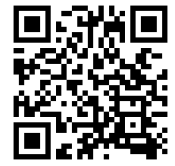
● 観光果樹園の情報は こちら