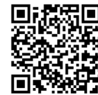
● 紅花まつりの情報は こちら

さくらんぼに続いて、紅花の季節も間もなくです。6月下旬からは村山地域各地で「紅花まつり」が開催されます。この季節ならではの村山地域の魅力を、ぜひお楽しみください！（観光振興室 023-621-8441）