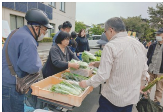
● てっぼう町青空市場の様子

5月3日（日）に今年の「てっぼう町青空市場」がオープンしました。この市場は、村山地域を中心とした農林水産事業者が直接販売を行う朝市で、村山総合支庁創設と同時にスタートし、今年で26年目を迎えます。