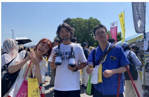
● 最後の一杯を購入された参加者と 連携ワイナリー社長の記念写真