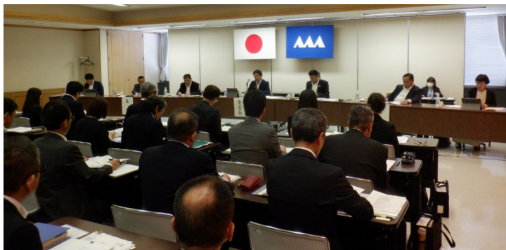
西村山・北村山地域議員協議会