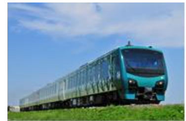
「リゾートしらかみ樫編成」