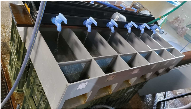
図1 試験に使用した水槽