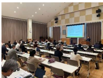
今年6月に大江町で開催した様子

（本セミナーは、山形県とあいおいニッセイ同和損害保険株式会社のやまがた創生に関する連携協定の一環として共同で開催するものです。）