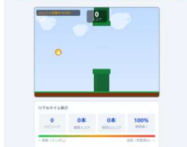
ゲーム用AIを育てよう — 報酬を設計してAIをゼロから育てよう

【0から始めたITエンジニアへの第一歩】 IT未経験からスタートした在校生の体験談と実際に作ったプログラムや取得した資格を紹介します