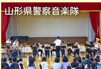
山形県警察音楽隊