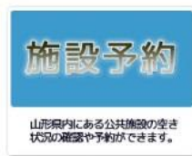
施設予約（外部サイトリンク）