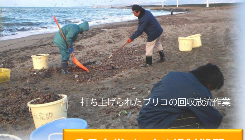
打ち上げられたブリコの回収放流作業