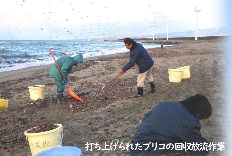
打ち上げられたブリコの回収放流作業