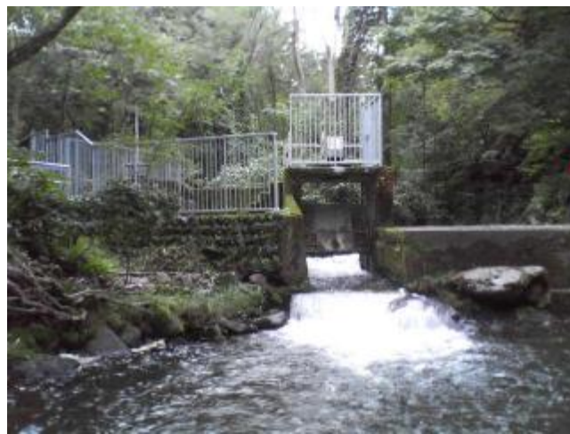
図2 早田川の取水堰（門が開いているところ）