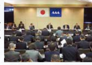
西村山・北村山地域議員協議会の様子

11月16日、各総合支庁において、今年度2回目の地域議員協議会を開催し、それぞれの地域における行政課題や施策について、地元選出の県議会議員が審議を行いました。