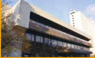
山形県議会議事堂