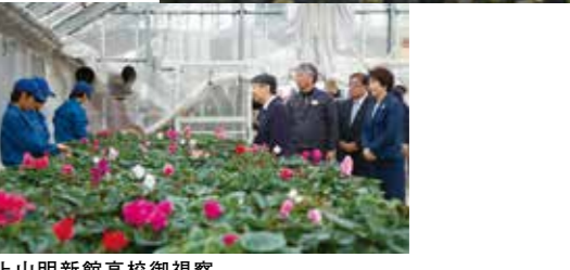
上山明新館高校御視察