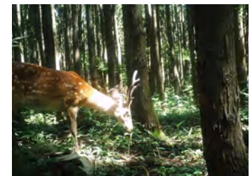
調査で撮影されたシカ (遊佐町)