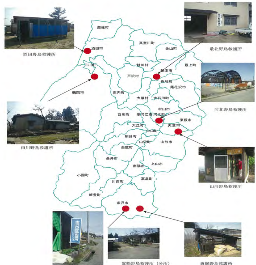
県内救護所位置図