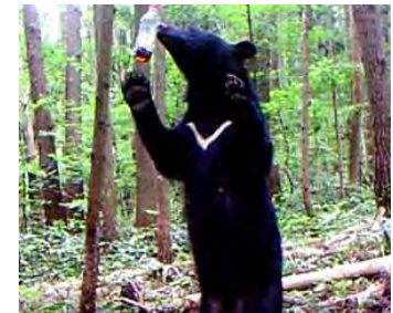
カメラトラップ調査状況