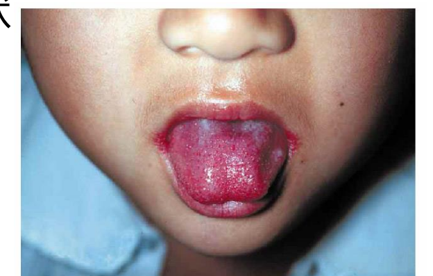
写真1. 典型的な莓舌 (国立感染症研究所HPより)

A群溶血性レンサ球菌咽頭炎は、患者の咳やくしゃみ等のしぶきに触れることにより感染するため、予防には、手洗いや咳エチケット等の一般的な予防法が大切です。