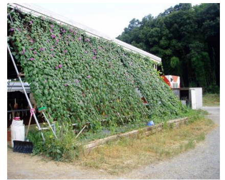
グリーンカーテン