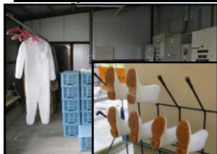
専用の服や靴の使用