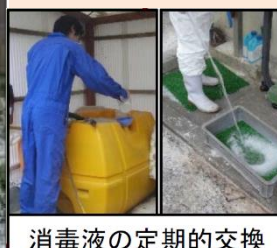
消毒液の定期的交換