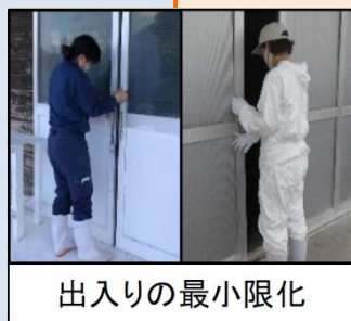
出入りの最小限化