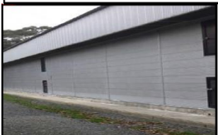
家きん舎周辺の 整理・整頓