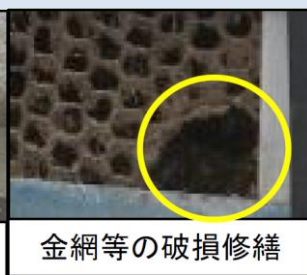
金網等の破損修繕