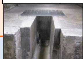
排水溝等からの 侵入防止対策 (鉄格子の設置)

飼っている鶏を毎日観察し、万が一異常を発見した場合には すぐに家保までご連絡ください！