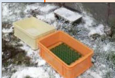
消石灰の散布や踏込消毒槽の 設置による消毒の徹底