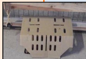
ねずみ対策 (トラップ設置)