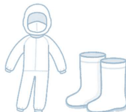
家きん舎専用 衣服・靴の使用