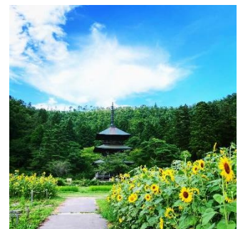
↓おきたま隠れ“映え”スポット