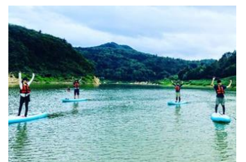
↑飯豊町 SUP 体験(8/28)

Facebook: 34件 Instagram: 57件 Facebook: 467人 Instagram: 556人