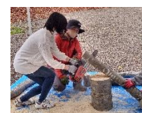
↑おきたまの魅力探検隊 小国・飯豊 自然堪能コース(11/13)