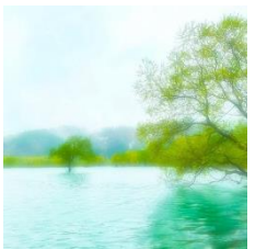
←「おきラボおすすめの魅力で賞」受賞作品