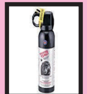
クマ撃退スプレー