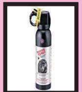
クマ撃退スプレー