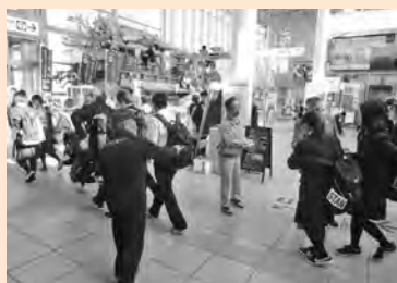
啓発活動・あいさつ運動の様子

「地域の子どもは地域で育てる」という視点で、学校や家庭、そして児童・生徒自身と地域の大人がコミュニケーションをとり、相互の信頼を深めながら、子どもの健やかな成長を支えるための環境づくりを推進しています。