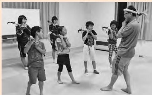
保存会の方から指導を受けている様子

このような取組みは、地域の中に世代を越えたつながりを生み、地域を元気にするとともに、子どもたちに郷土に対する誇りと愛着を育んでいます。