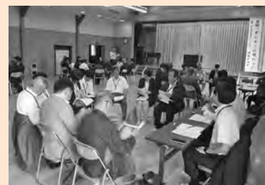
児童・生徒と地域の大人の対話会