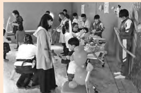
げんキッズでバルーンを来場者に配る様子