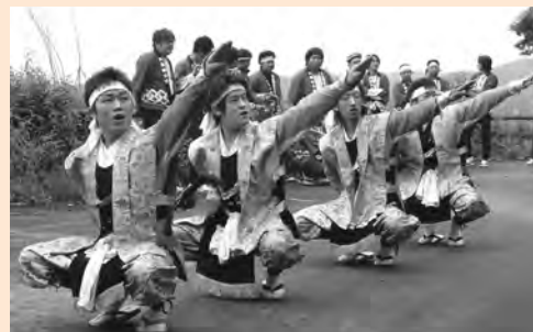
伝統を受け継ぎ、保存会の踊り手として活躍