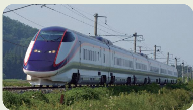
山形新幹線つばさ